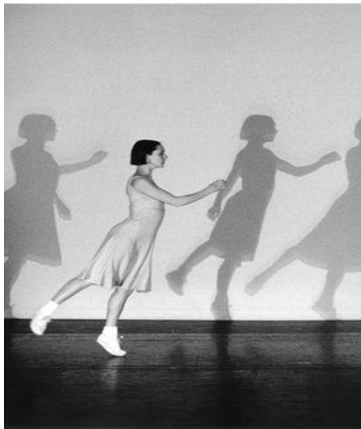
Fase , (1982) d'Anne Teresa de Keersmaeker