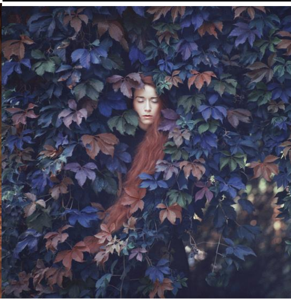
Oleg Oprisco , photographe ukrainien